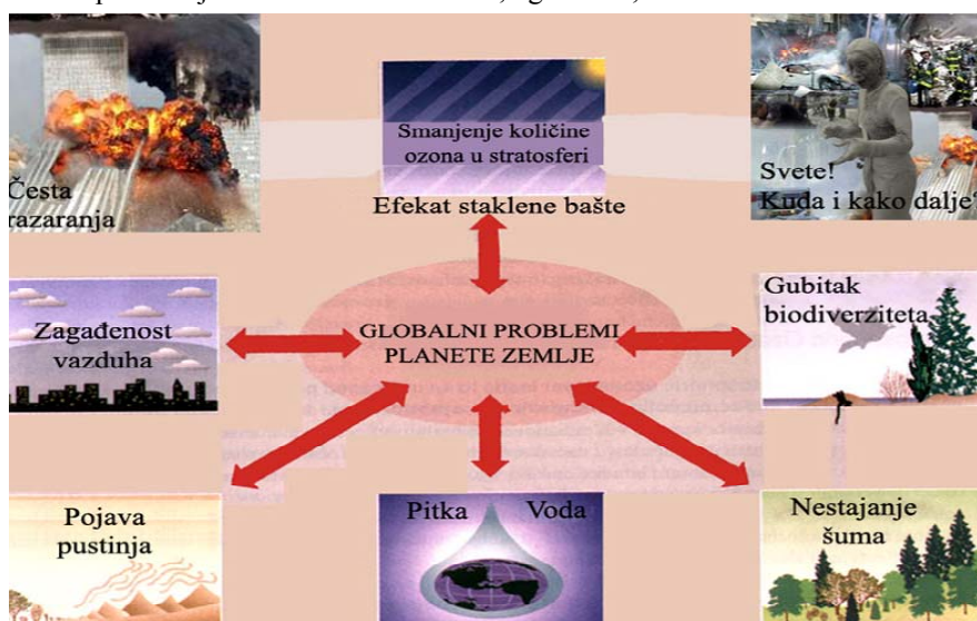
Slika 1: Globalni problemi planete Zemlje

Većina životnih namirnica je zagađena biološki, hemijski i radionuklidima. Došlo je do zagađivanja zemljišta unošenjem otpadaka, taloženjem zagađivača vazduha (aerosedimenta) preko zagađene vode, pri poljoprivrednoj proizvodnji, otpadnim komunalnim i industrijskim materijalom i dr. Na kraju ovde treba dodati nuklearne reaktore, njihov vek trajanja (jačih) je oko 30 godina. Početkom 21. veka prestaje sa radom oko 300 reaktora. Ostaje da nove generacije reše pitanje nuklearnog otpada, zagađenog vazduha, voda, životnih namirnica i zemljišta, jer je naša generacija probleme iz oblasti zaštite i unapređivanja životne i radne sredine, uglavnom, vrlo malo rešila.