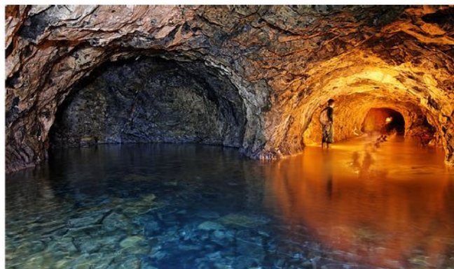
Slika 5: Podzemne vode

Podzemna voda je značajna za vodosnabdevanje stanovništva. Poslednjih godina podzemne vode se sve više zagađuju. Takođe podzemne vode rastvaraju materije (minerale) od kojih se sastoji zemljina kora. Takve vode često kroz duboke pukotine izbijaju na površinu zemlje u vidu izvora mineralne vode.