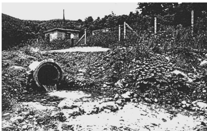
Slika 7: Izvori zagađenja voda

Među važnije zagađivače površinskih i podzemnih voda ubrajaju se: industrijske i komunalne otpadne vode, otpadne vode sa poljoprivrednih zemljišta i termoenergetskih objekata, kao i od rasutih izvora zagađivanja: pri proizvodnji i preradi ruda, proizvodnji i preradi nafte, od deponija smeća i dr. (sl. 7).