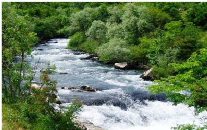
Slika 4: Površinske vode

Konstatovano je da je nestašica vode najkritičniji faktor koji može da unazadi društvo. Poznati francuski akademik Žan Rostan (Jean Rostan) iznosi, da su brojne reke zagađene stalnim izlivanjem voda iz kanalizacija i otpadnih industrijskih voda, više ili manje toksičnih, i da usled njihove toksičnosti preti opasnost za zdravlje ljudi, za faunu slanih voda, nastaje šteta za gajenje riba i ribolov uopšte, za agrokulturu, šteta za turizam itd.