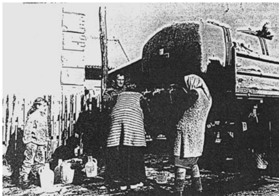
Slika 3: Bez vode nema života

podsekretar UN i bliski saradnik Kofi Anana.